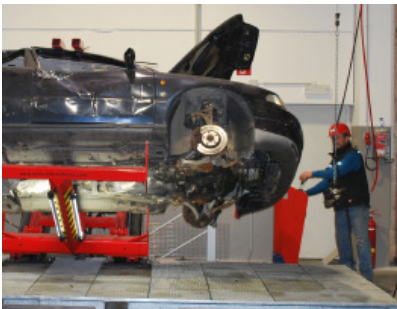
Kolay kumanda paneli

Kol içinde gizlenen istek doğrultusunda hazırlanan iç tesisat