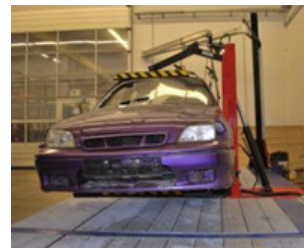
Kol ile sabitleyin