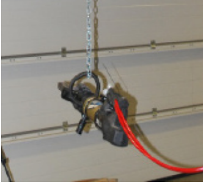
Entegre geri dönüşüm çalışma aletleri