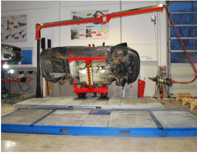
Damlama tavaları ile çevrelenebilir