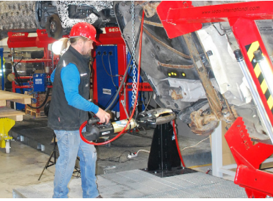
Araç altında daha kolay çalışma