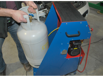
Tekerlekli yapı içinde arka tarafta terazi üzerinde yer alan tüp kolayca değiştirilebilir.