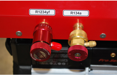
R1234yf ve R134a için adaptör

ACR L-52320 Klima gazı vakumlama cihazı, R1234yf ve R134a için