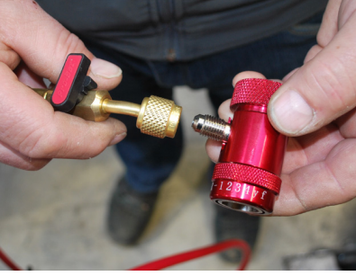
Basit adaptör değişimi