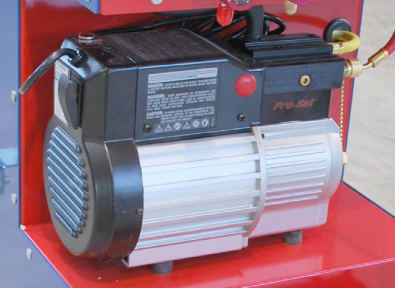
Soğutma maddesi boşaltma cihazı CC220